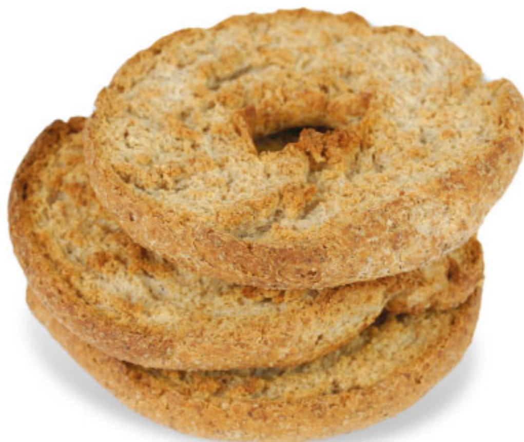
< FRISELLE INTEGRALI