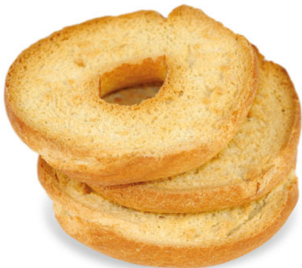
< FRISELLE CASERECCE